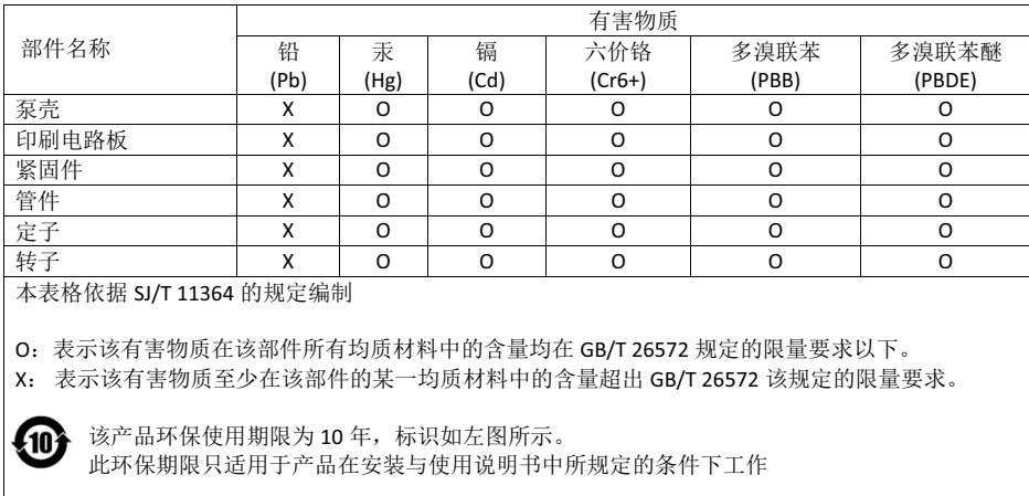
产品中有害物质的名称及含量